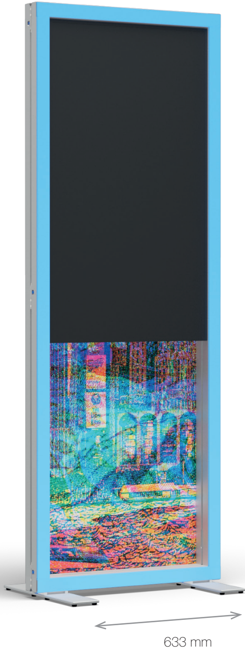
Vorderansicht Front view